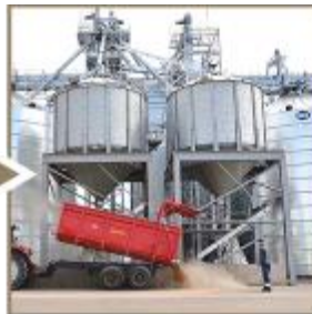
Grūdų ir žaliavų pašarams paruošimas ir pardavimas