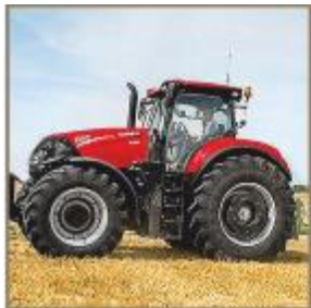
Prekės ir paslaugos žemdirbiams

Grupės veikla yra skirstoma į keturis pagrindinius veiklos segmentus. Skirstymą į atskirus segmentus lemia skirtingos produktų rūšys bei su jais susijusios veiklos pobūdys, tačiau dažnai segmentų veikla yra susijusi tarpusavyje.