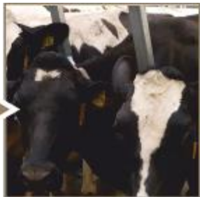
Žemės ūkio produktų gamyba