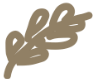
Žemės ūkio produktų gamyba