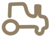
Prekės ir paslaugos žemdirbiams

Grupės veikla yra skirstoma į keturis pagrindinius veiklos segmentus. Skirstymą į atskirus segmentus lemia skirtingos produktų rūšys bei su jais susijusios veiklos pobūdis, tačiau dažnai segmentų veikla yra susijusi tarpusavyje.