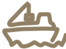
Grūdų ir žaliavų pašarams paruošimas ir pardavimas