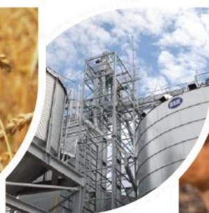
grūdų ir žaliavų pašarams paruošimas ir pardavimas