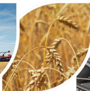
žemės ūkio produktų gamyba