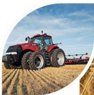
prekės ir paslaugos žemdirbiams

Grupė yra vienas didžiausių lietuviškų grūdų eksportuotojų, turi nuosavą modernių grūdų saugyklų tinklą. Taip pat vienas iš prekių žemdirbiams (sertifikuotų sėklų, trąšų bei žemės ūkio technikos) tiekimo lyderių Lietuvoje, turi sėklų paruošimo gamyklą. Taip pat Grupė yra ir stambi pieno gamintoja Lietuvoje ir paukštienos gamintoja Latvijoje.