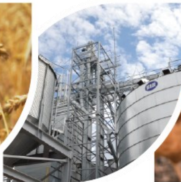
grūdų ir žaliavų pašarams paruošimas ir pardavimas