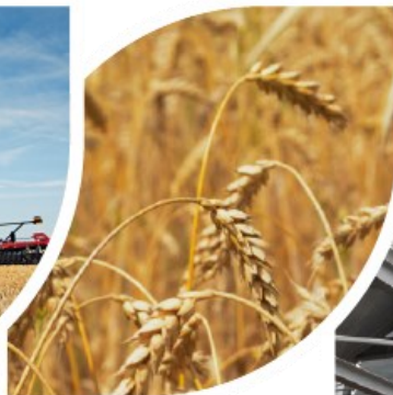
žemės ūkio produktų gamyba