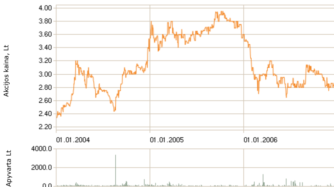
16.1. pav. Prekyba bendrovės akcijomis 2004-01-01 – 2006-12-31