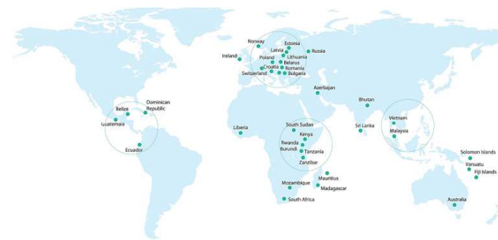
UAB BAIP grupė veiklos geografija

„INVL Technology“ ketina siekti Lietuvos banko išduodamos uždaro tipo investicinės bendrovės licencijos (toliau – UTIB) ir savo esme tapti panašia į fondą.