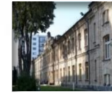
„Žygio verslo centras“: B.P. 3 200 m 2