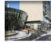
„Vilniaus vartai“: B.P. 8 100 m 2