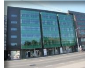
„IBC“ A klasės verslo centras: B.P. 11 400 m 2

2015 m. rugpjūčio 17 d. prie bendrovės prijungta patrunuojanti įmonė, kurios akcijos nuo 2014 m. birželio 4 d. buvo įtrauktos į NASDAQ Vilnius Baltijos Papildomąjį prekybos sąrašą. Bendrovės akcijos į NASDAQ Vilnius Baltijos Papildomąjį prekybos sąrašą yra įtrauktos 2015 m. rugsėjo 16 d.