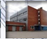
Biurų ir sandėlių patalpos Kirtimuose: B.P. 3 000 m 2