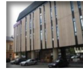
Biurų pastatas Vilniaus g.: B.P. 9 800 m 2