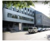
„IBC“ B klasės verslo centras: B.P. 11 300 m 2