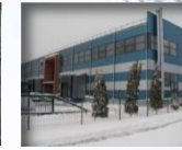
„Dommo business park“: B.P. 12 800 m 2