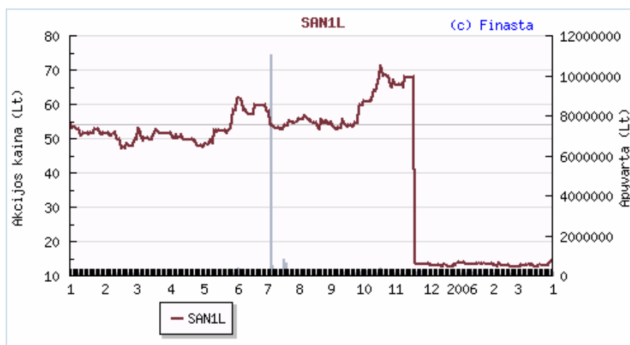
15.1. pav. Prekyba AB „Sanitas“ paprastosiomis vardinėmis akcijomis VVPB nuo 2005-01-01 iki 2006-03-31