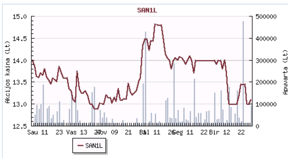
9.1. pav. Prekyba bendrovės akcijomis VVPB 2006-01-01 – 2006-06-30