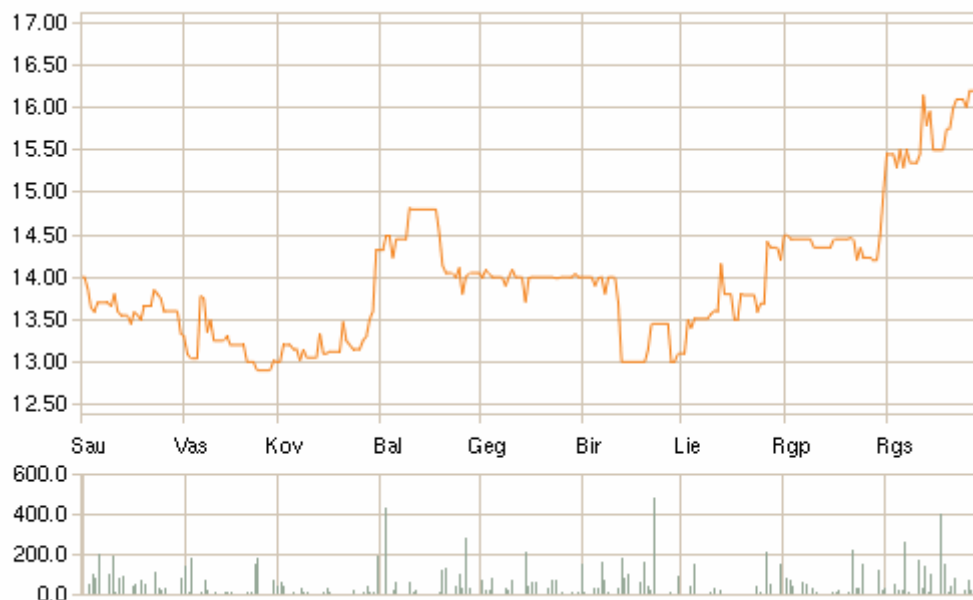
13.1. pav. Prekyba bendrovės akcijomis VVPB 2006-01-01 – 2006-09-29

13.3. lentelė. Bendrovės akcijų, įtrauktų į VVPB Oficialųjį prekybos sąrašą, kapitalizacija